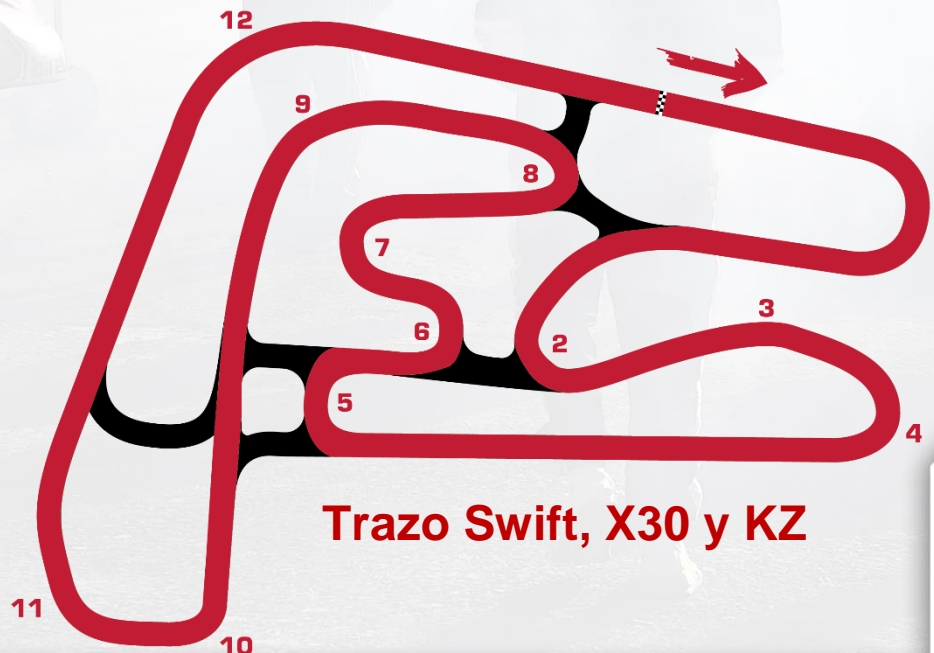
Trazo Swift, X30 y KZ